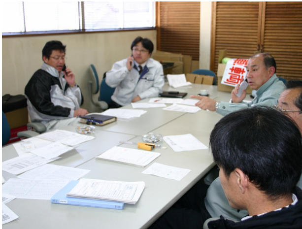
▲災害支援に向けて準備（3月14日～18日まで）