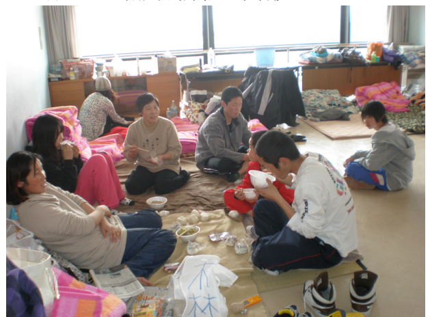
▲ 3月20日 岩沼市民会館に避難する被災者の様子