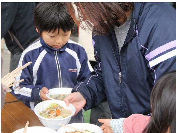
▲ 3月20日 岩沼市民会館でトン汁とおにぎりの振舞い