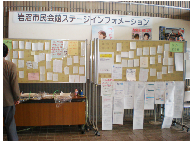
▲ 3月20日 岩沼市民会館内の伝言板