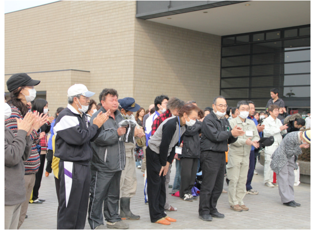
▲ 3月20日 am11:30 岩沼市民会館到着し、歓迎を受ける