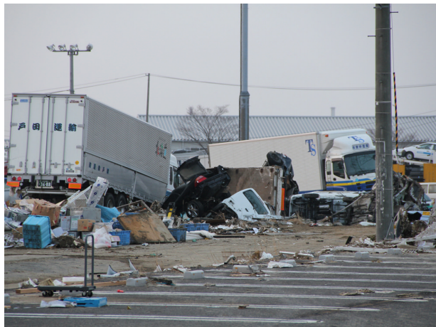
▲3月20日 塩釜港周辺の様子