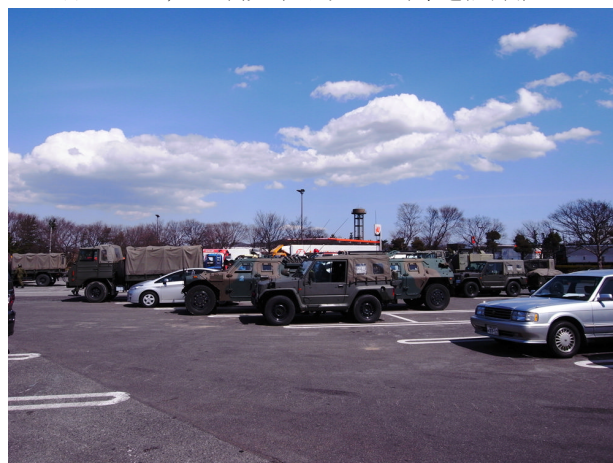
▲3月19日 高速道路 安達太郎SA内の緊急車両群