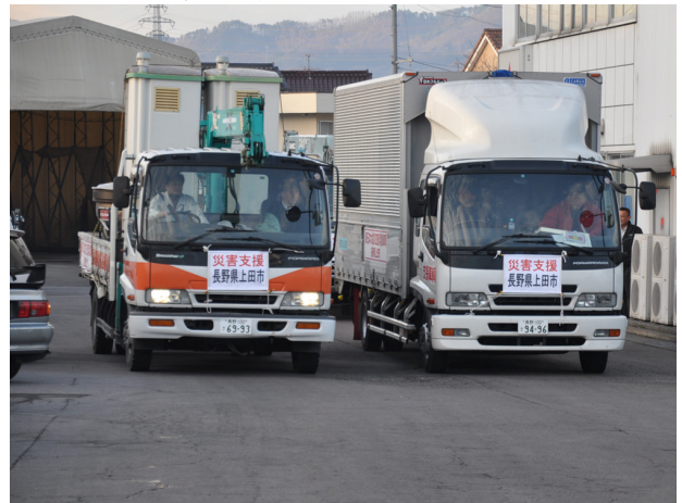
▲3月19日am, 6:00 出発(救援物資+資機材4t車3台)