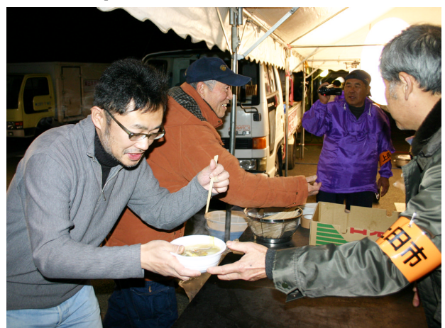
▲3月19日 暖かい食物を口にするのは初めてだったとのこと