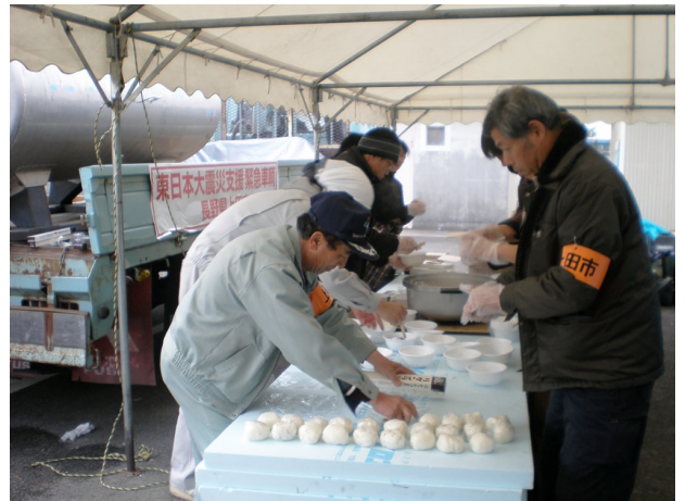
▲3月20日 am, 5:30 起床 朝食用のおにぎり準備