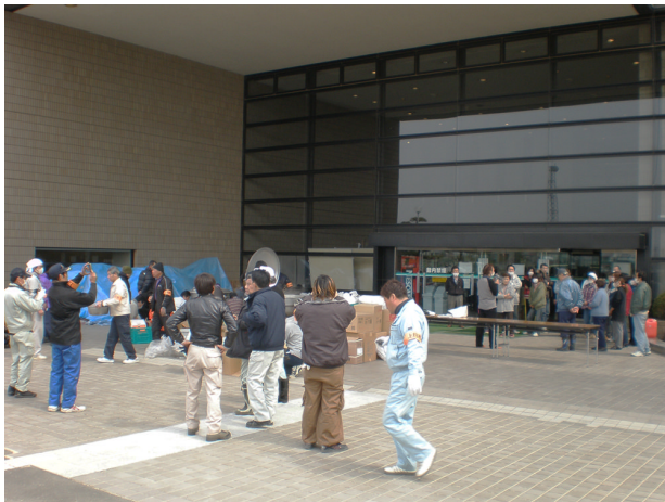
▲ 3月20日 am, 11:40 岩沼市民会館にて昼食の準備開始