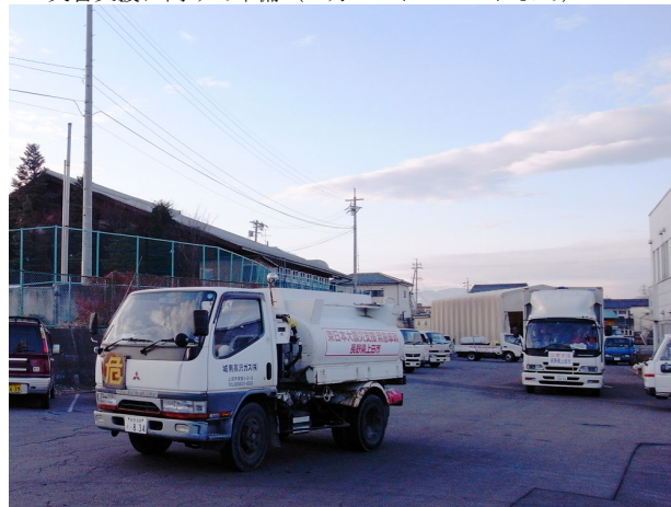
▲3月19日am, 6:00 出発（トラック10台、連絡車両）