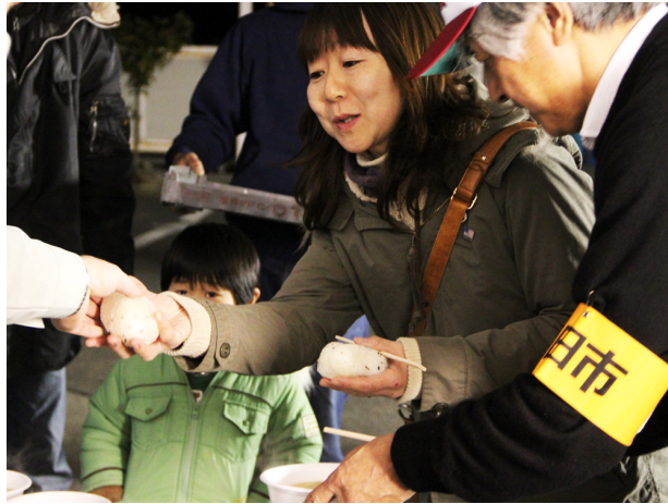
▲3月19日 満面の笑みに胸が熱くなる