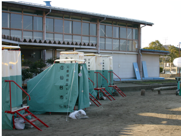
▲3月20日 中野栄小学校に設置された仮設トイレ