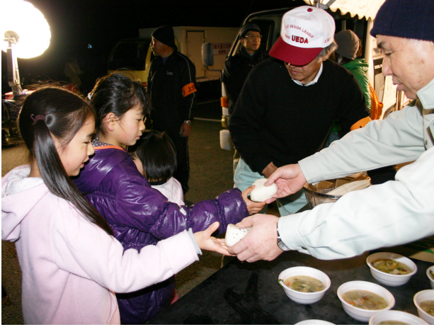
▲3月19日 子供達の笑顔が救い