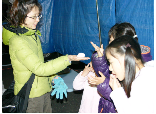
▲3月19日 おにぎりを一粒残らず食べつくす