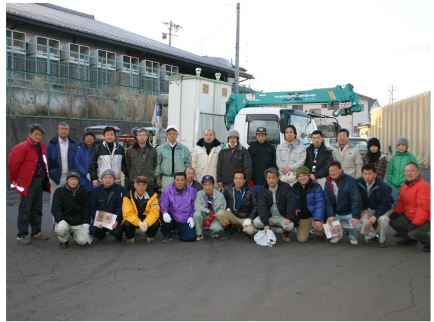
▲3月19日am, 5:30 集合（参加者25名）※太田副会長見送り