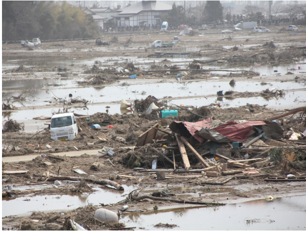
▲ 3月20日 名取市から岩沼市周辺の様子