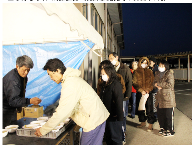
▲3月19日 炊き出しに長蛇の列