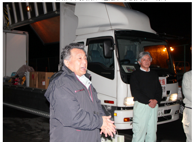
▲ 3月20日 pm, 11:30 上田（三菱ふそう）にて解散