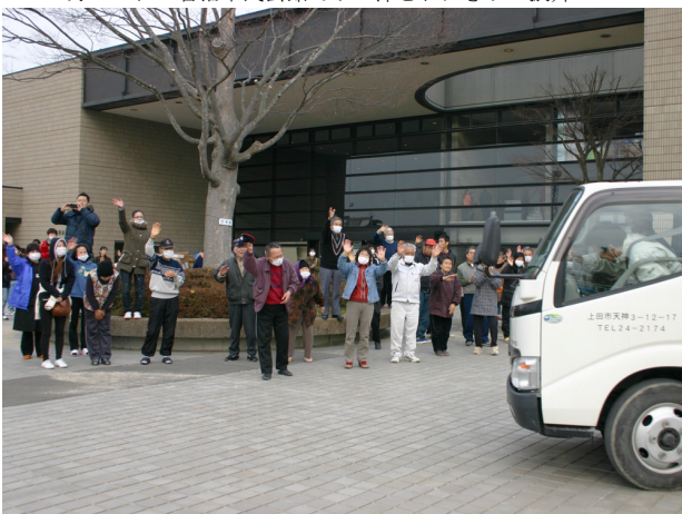
▲ 3月20日 pm, 3:30 岩沼市民会館を帰路へ