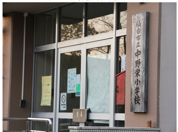
▲3月19日pm. 2:30頃に仙台市立中野栄小学校に到着