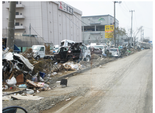
▲3月20日 仙台市宮城野区周辺の様子